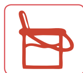
SOLVANTS / PEINTURE