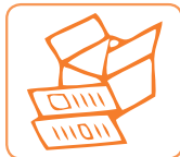
PAPIER / CARTON