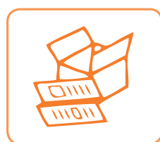
1 TONNE DND