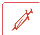
DARSI Déchets d'activité de soins à risques infectieux