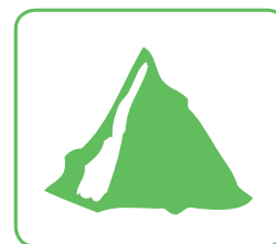
TERRE / DÉBLAIS