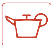
HUILE DE VIDANGE